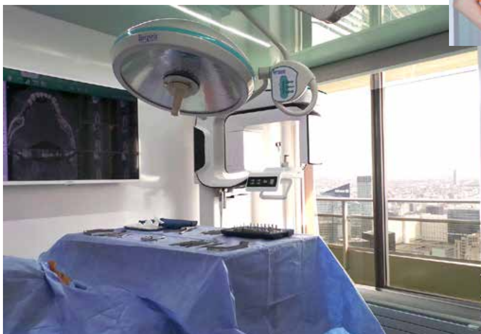
Opération... à ciel ouvert !