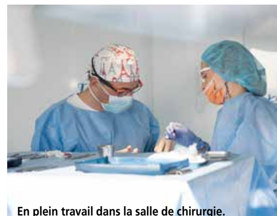
En plein travail dans la salle de chirurgie. La toque est un petit clin d'œil à la Dame de fer, voisine de palier.