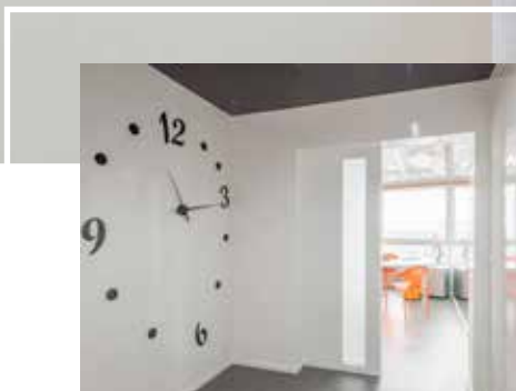
Un cabinet bien dans son temps et un praticien toujours à l'heure.

Ci-dessous, la salle de stérilisation. Des meubles Ikéa, ont été adaptés. La salle sert également de refuge pour la prise de clichés. La vitre qui donne sur le fauteuil d'omnipratique est plombée.